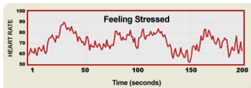
Hart ritme bij druk

Tegelijkertijd remt het ons brein om efficiënte motorische netwerken aan te spreken en juiste beslissingen te nemen. Positief gevoelde emoties, zoals waardering, gaan gepaard met een harmonieus en coherent hartritme patroon en een gezond functionerend hart-brein systeem. Dit genereert een toename in veerkracht, in energie niveaus, in mentale helderheid en motorische vaardigheid